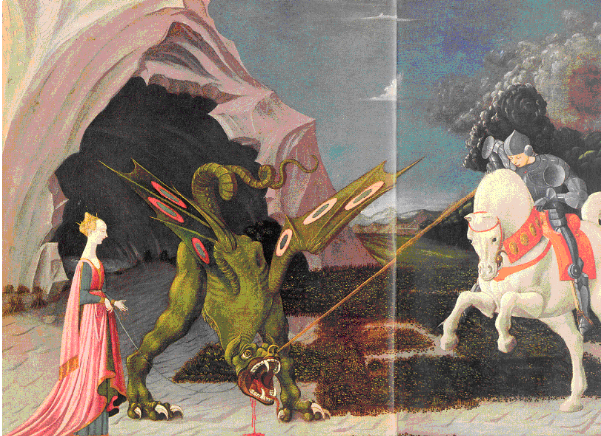
Sint Joris en de draak, Paolo Uccello, 1397-1476