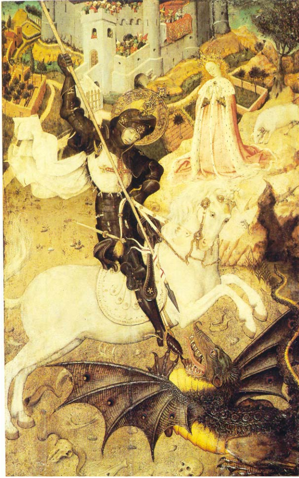
Sint Joris en de draad, Bernardo Martorell, 1430